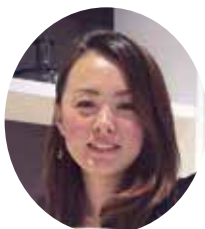
福岡県よろず支援拠点 コーディネーター

ブログやSNS、ホームページ、チラシなど、売上に大きく直結し、即効性のある方法の活用について学びます。