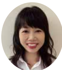
福岡県よろず支援拠点 コーディネーター

創業時や、創業後、事業を広げていく際に必要な設備投資を行う場合の、税務面で注意すべきポイントについて分かりやすく学びます。